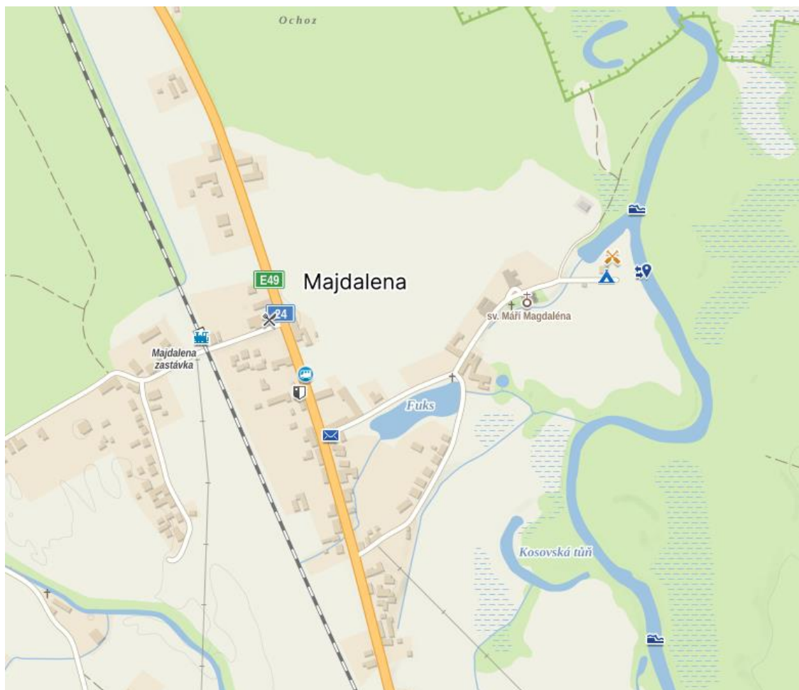
tábořiště v Majdaleně

Odjezd: Po vlastní ose. Vlakem či jinak z Lužničanky. Doprava zavazadel na nádraží v Malšicích zajištěna.