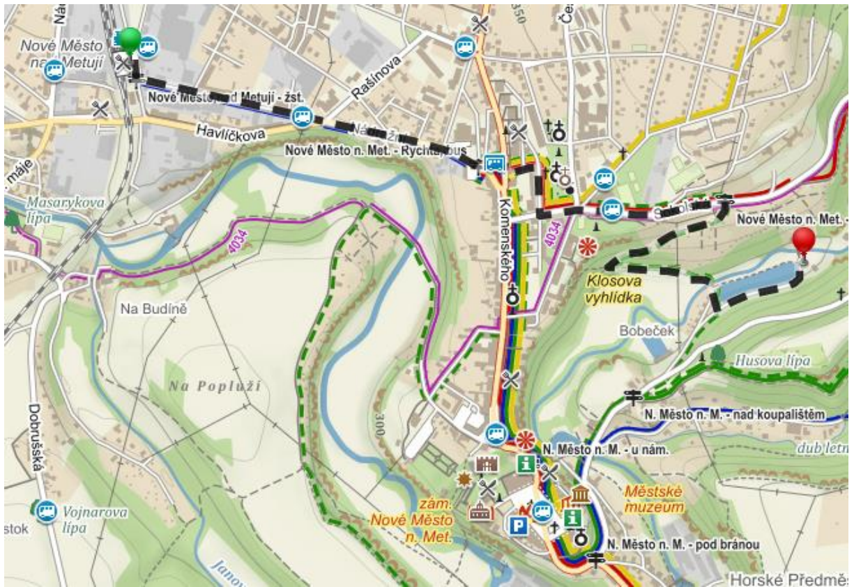
Skautská klubovna v Novém Městě nad Metují od vlaku