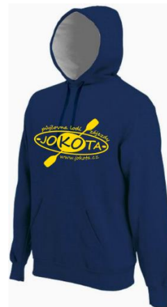
mikina s kapucí a klockankou 500 Kč/kus

Oblečení je potřeba objednat nejpozději do 25. 7. 2021, abychom ho stihli nechat vyrobit!