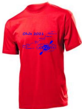
pánské tričko 220 Kč/kus