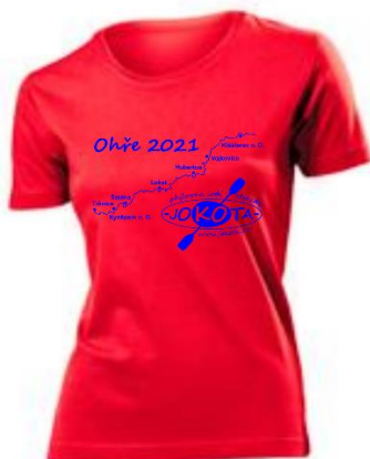
dámské tričko 220 Kč/kus