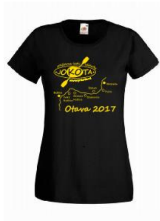
dámské tričko 190 Kč/kus

Oblečení je potřeba objednat nejpozději do 30. 6. 2017, abychom ho stihli nechat vyrobit!