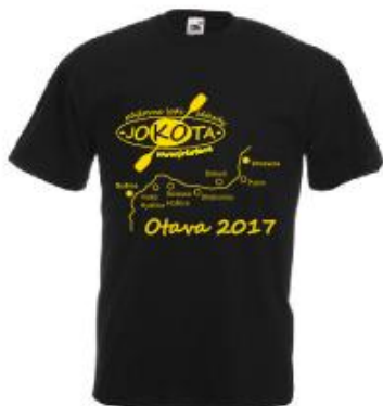
pánské tričko 190 Kč/kus