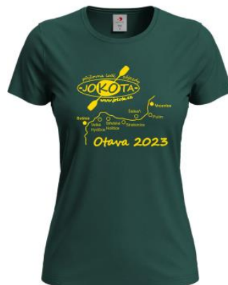
dámské tričko 270 Kč/kus

Oblečení je potřeba objednat nejpozději do 30. 6. 2023, abychom ho stihli nechat vyrobit!