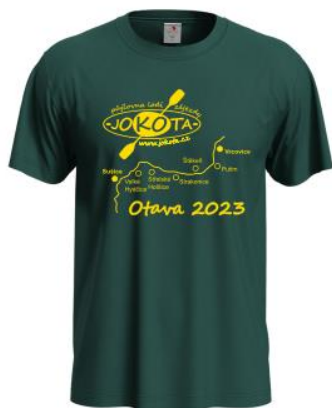
pánské tričko 270 Kč/kus